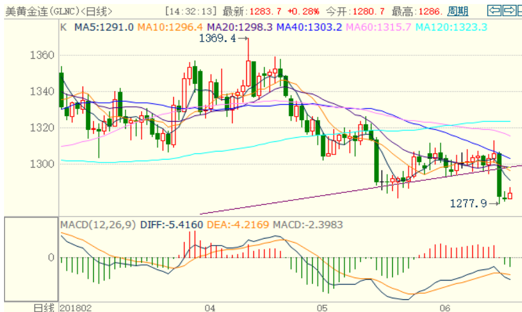
图 1：COMEX 黄金主力合约技术分析