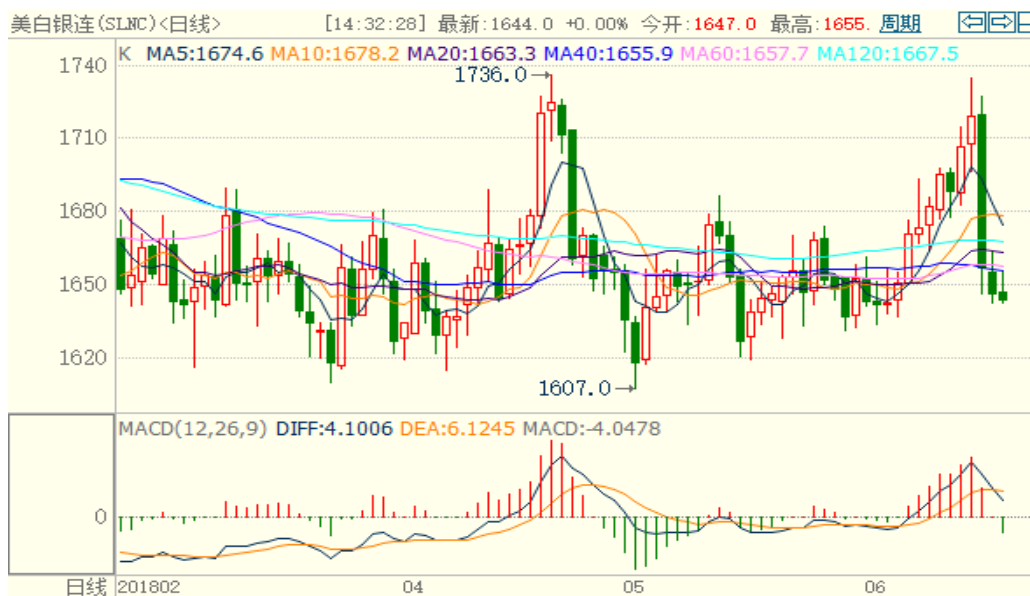
图 2：COMEX 白银主力合约技术分析